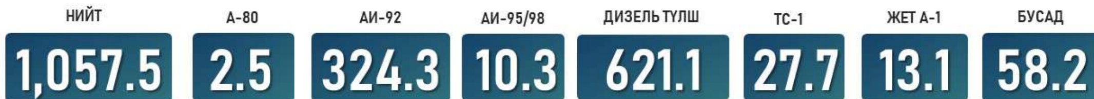
ГТБ-НИЙ ИМПОРТ /Төрөл/